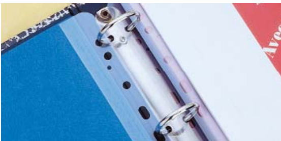
Pásek pro uložení svazku do pořadače.

Nalepením transparentního pásku na termodesky po provedení vazby dosáhnete možnosti ukládat vaše vyvázané dokumenty do pořadačů.