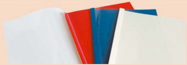
Termodesky PRESTIGE (barevný karton, imitace kůže 225 g)