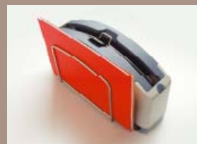
Svázané dokumenty odložte na několik minut na chladicí držák stroje.