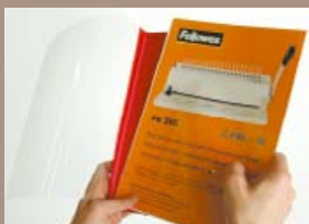
Podle síly svazku zvolte vhodně termodesky.