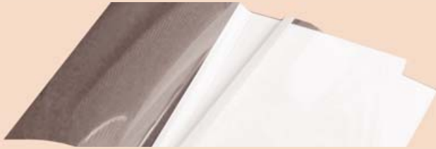
Termodesky STANDING (bílý karton 250 g)

PRESTIGE - přední strana transparentní fólie, zadní strana barevný karton* s ražbou imitace kůže 225 g