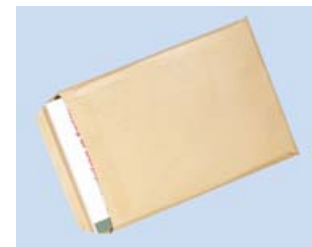
Díky hladkému hřbetu můžete snadno svazek vkládat do obálky.