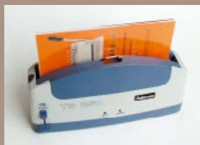
Svazek nebo více svazků vložte do termovazeče. Po uplynutí asi 35 s signalizace oznámí ukončení vazby.